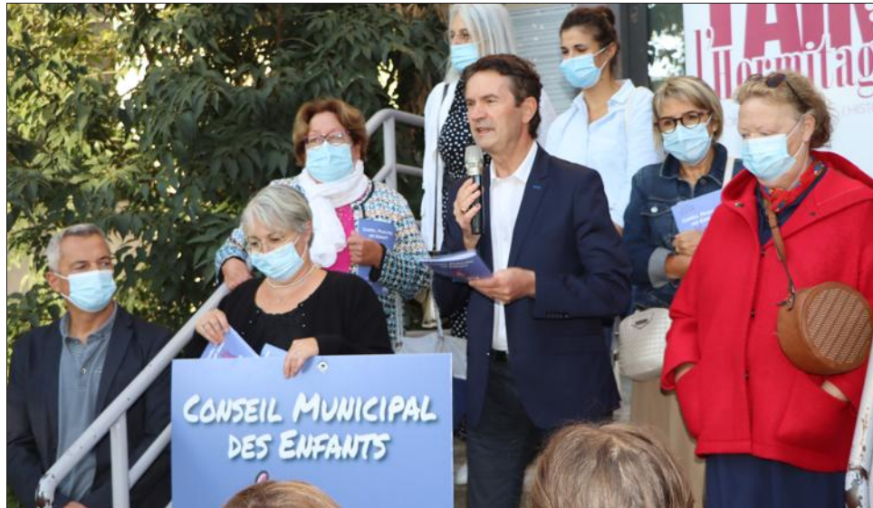
Judi 23 septembre, à l'école Jules-Verne élémentaire, le maire Xavier Angéli présente les grandes lignes du conseil municipal des enfants aux élèves de CM1 et CM2.

La première séance plénière officielle d'installation du premier conseil municipal des enfants de Tain-l'Hermitage avec ses 18 conseillers soit neuf binômes (garçons et filles) est déjà programmée ; ce sera le mercredi 20 octobre dans la salle du conseil municipal. Xavier Angéli et Michelle