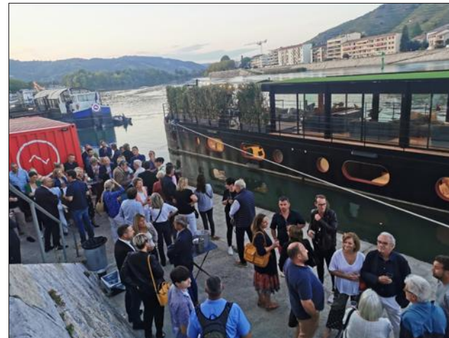
La Péniche et les nombreux invités

Cette création originale est composée de cinq cabines et 11 couchages avec une chambre familiale avec petit-déjeuner inclus, d'un grand espace partage avec cuisine, d'un jardin d'hiver ou encore d'un espace dé-