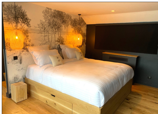
Les 5 cabines premium de 20 m 2 chacune offrent une vue au fil de l'eau depuis le lit King Size « ultraconfort ».