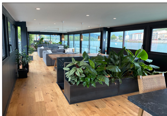
La configuration de l'espace de vie ou jardin d'hiver (50 m 2 ) autorise toutes les options : le partage et l'échange social entre hôtes ou le contraire, selon la nature et le tempérament des uns et des autres.

Il est possible de privatiser l'espace pour certaines occasions : anniversaires, enterrements de vie de jeune fille/garçon... mais aussi pour des événements corporate, des soirées VIP, etc.