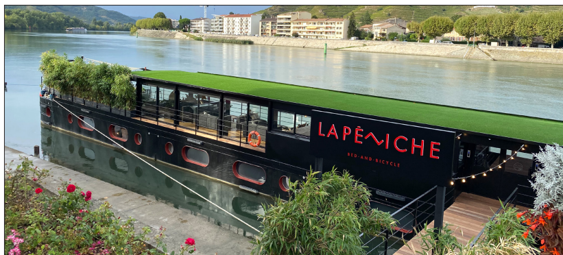
La Péniche Bed and Bicycle accueille tous les publics, mais à la différence des autres hébergements des environs, elle est équipée pour loger les cyclistes et leur monture.